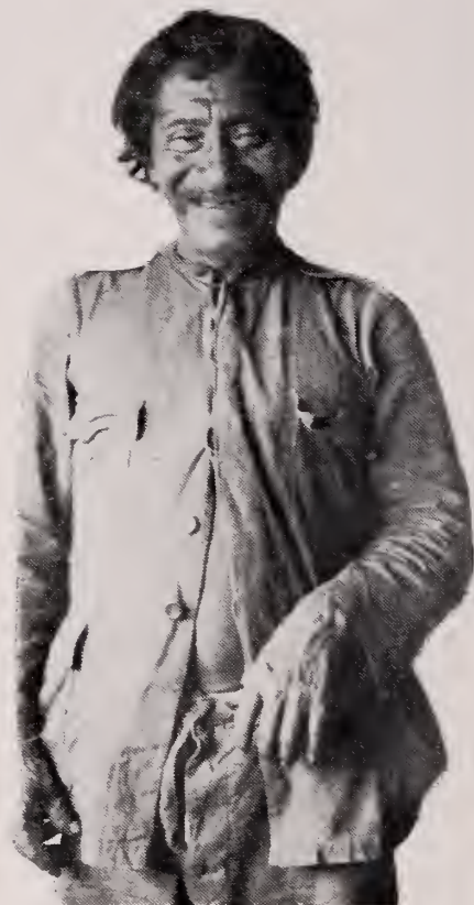
Típico Indio Goajibo de la Misión de PP. Salesianos en el Alto Orinoco.

¿Cómo te llamas, niño?—Levanta éste lo sojos, los baja luego y emite un sonido gutural incomprensible. ¿Tienes padres? —No res-